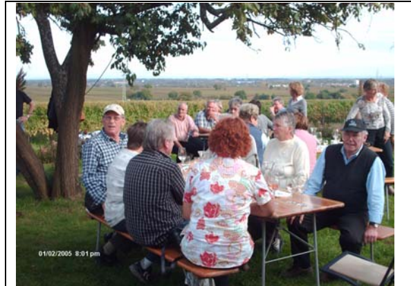
Trotz Trübung geht der Blick weit

aus. Versehen mit einer Wegzehrung –na was wohl (?) – richtig: Wein (!) verließen wir den Winzerhof.