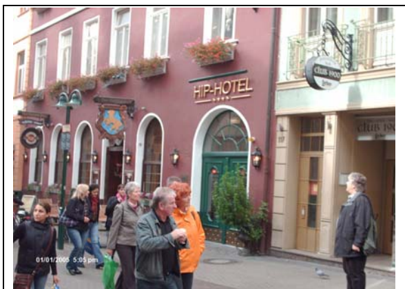
Mit Guide in Heidelberg