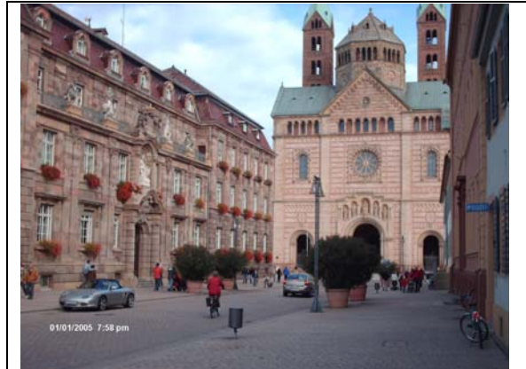
Das „Kapellchen“ von Speyer

Das „Kapellchen“ zu Speyer, während des Mittelalters als größtes Gebäude der Welt geltend, diente als nächste Kulisse für unseren Luxusreisebus. Ihm entstiegen, waren es nur wenige hundert Meter zum Bischofssitz und der benachbarten Hausbrauerei.