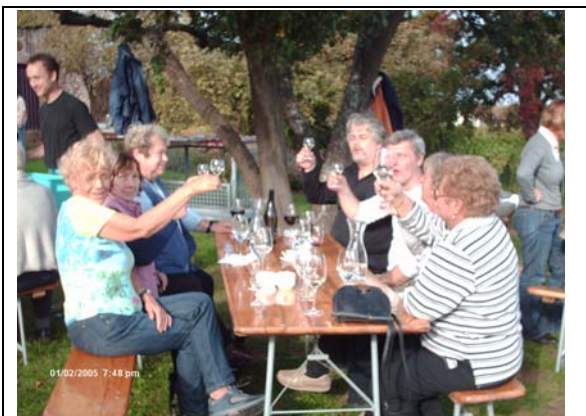
Nach getaner Arbeit – hoch die Tassen / Gläser

wohl eintausend Flaschen Grauburgunder ergeben werde. Diese, mit besonderer Etikettierung versehen, werden selbstredend an den Busch zurückgeführt um dort als Flaschenwein verkauft oder in der Vereinsgaststätte verkostet zu werden (also: greift im nächsten Jahr zu!!!). „Zeichen setzen“ war das Motto, das der Begegnung zwischen Wein, Winzer und Gästen vorangestellt war. Nachhaltiges Zeichen unseres Besuchs sollte die Pflanzung einer Edelkastanie werden, die, am Nachmittag von Mitarbeiterinnen einer Baumschule geliefert, auch von ihnen am Rande unseres Vesperplatzes, unmittelbar am Hof, vorgenommen wurde. Dieser Baum, so Theobald Pfaffmann, soll, wenn er einst seine Krone über den Ort unserer Vesperrunde neigt, Zeichen sein für unsere Begegnung.