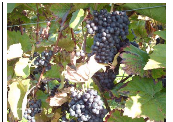
Wahrlich ein Geschenk der Natur

Fazit: Diese Tage waren beeindruckend! Das Erlebte wirkt nachhaltig. Nur von einer Weinfahrt zu reden, wird dieser Begegnung nicht gerecht, sie war mehr. Was hier vermittelt wurde, lässt sich nicht am Fahrpreis ermessen. Es war die umfassende Hinwendung zu einem Produkt, das lebt, sich entwickelt, zu dem ein auch emotionales Verhältnis wachsen kann.