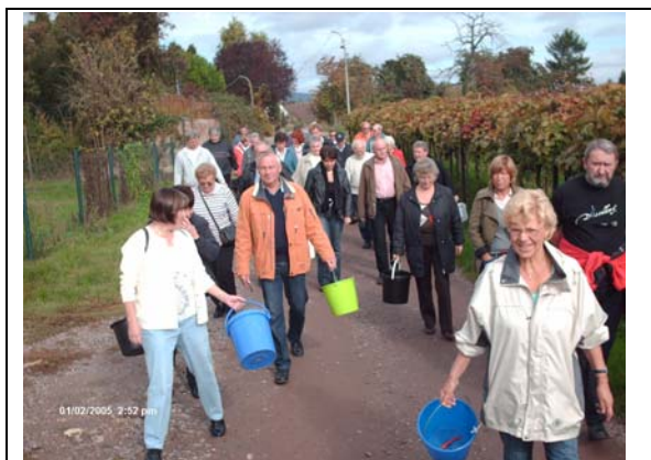
Auf in den Wingert !

Nachdem die ersten Hektarerträge in den von Traktoren in den Wingert gezogenen Erntefahrzeugen gesichert waren, wurde die Lese unterbrochen mit –na was wohl (?) – richtig: Wein (!). Mit Rotem, Weißen, Secco und Rosé, die in vielerlei Variation und unbeschränkter Menge bereitgestellt wurden, gelang es, die Mühen der Lese seelisch zu überwinden. Schnell noch einige Fuder verlesen, und der Wingert konnte als besiegt zurückgelassen werden.