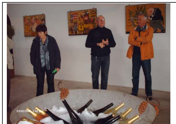
Theo erklärt: Theorie und Praxis

Soho liegt am Stadtrand von Landau in der Pfalz. Es ist ein Hotel und ziemlich neu. Dort eingekcheckt (schöne Zimmer) ging es per Pannabeckerbus sofort zum Ziel unserer Reise.